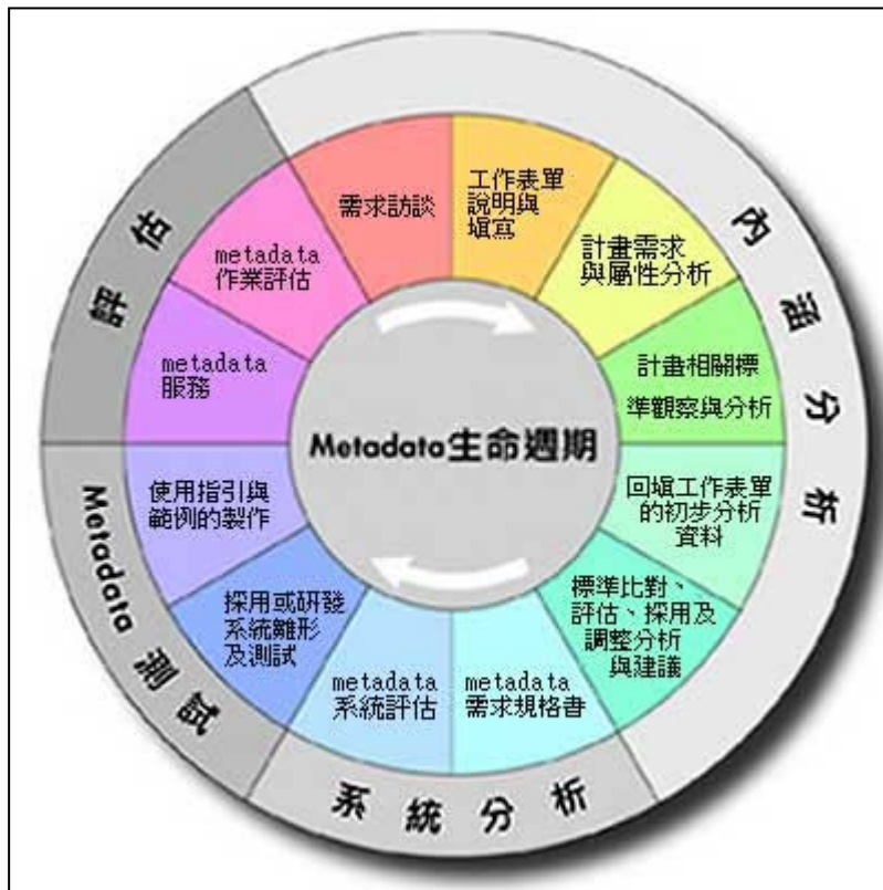
圖 1 後設資料(Metadata)生命週期作業模式